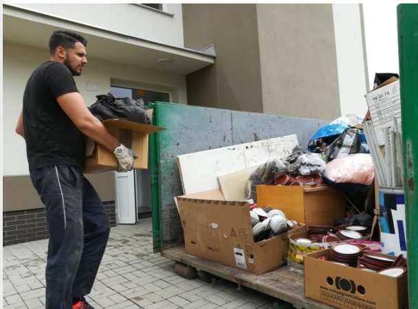
Firemní dobrovolnický den – penzion pro důchodce