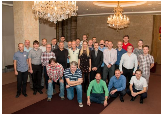
Materiální sbírka v rámci „Října pro neziskovky“