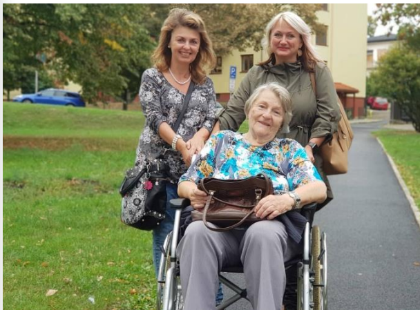
Firemní dobrovolnický den – penzion pro důchodce