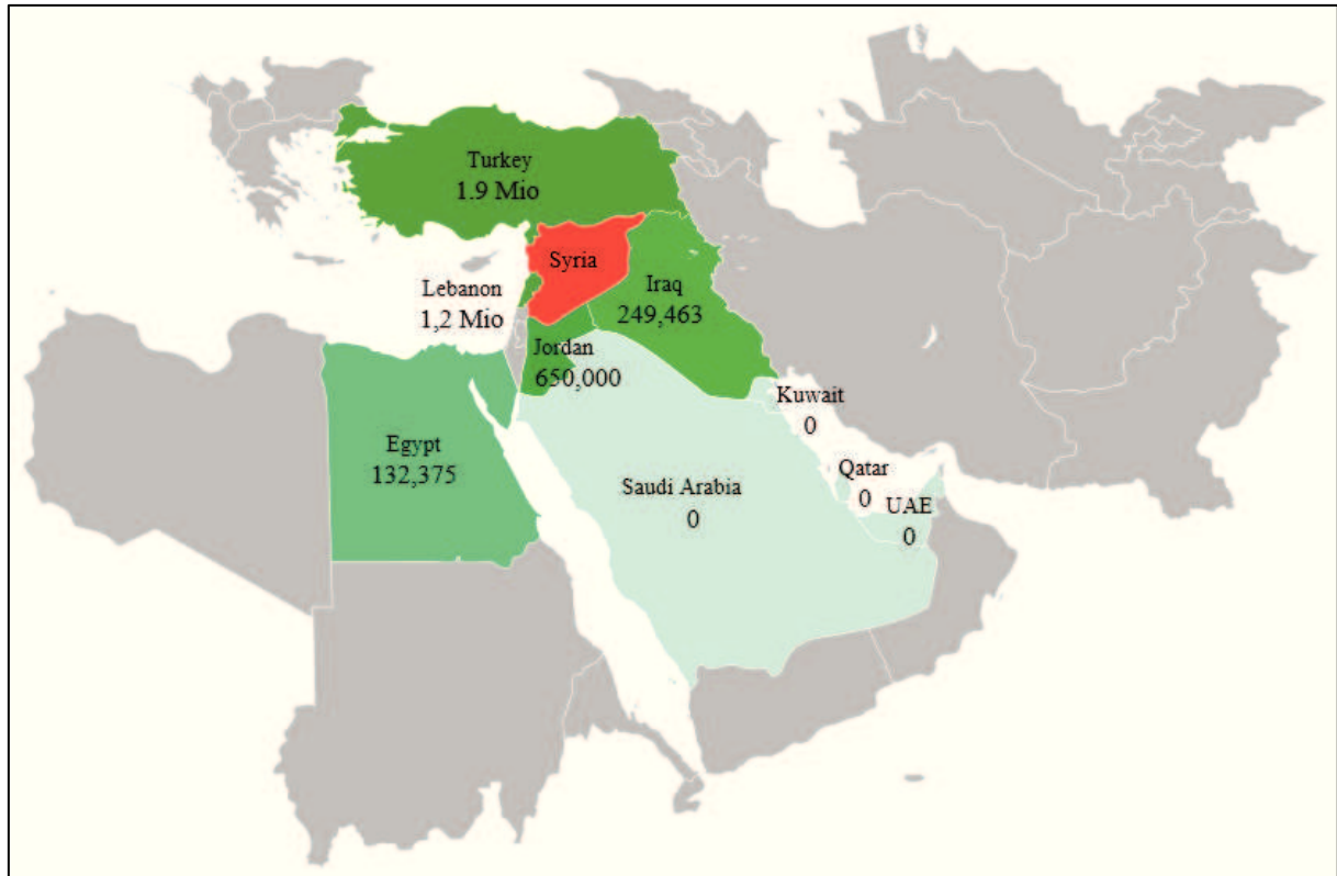
Obrázek 3: Počet uprchlíků ze Sýrie v okolních zemích k 4. září 2015

milionů dětí je v situaci, kdy potřebují humanitární pomoc. Vzhledem k neustálému rozšiřování oblasti válečného konfliktu a zasažení i dříve bezpečných míst je opakované přemísťování osob nápadným znakem syrského konfliktu.