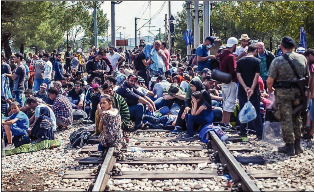
Obrázek 8: Uprchlíci při čekání na řecko-makedonské hranici

U adolescentů je nejčastěji uváděným způsobem zvládnání situace stažení se do sebe nebo povídání si s rodiči a přáteli. Rodina může fungovat jako silná opora, obzvláště pro dospívající jedince, kteří prožili vysídlení nebo násilí spojené s válečným konfliktem. Pokud ale rodiče sami obtížně zvládají vzniklou situaci a zodpovědnost za ochranu dětí, mohou ztrácet schopnost účinně emočně podpořit děti. Vzhledem k extrémnímu stresu vyplývajícímu ze sociální a finanční nejistoty zmiňují někteří rodiče i nevhodné projevy jako je bití svých dětí nebo přehnaně úzkostná péče o ně. Mnoho adolescentů nechce své emoční potíže se svými rodiči sdílet, protože je nechtějí ještě více zatěžovat.