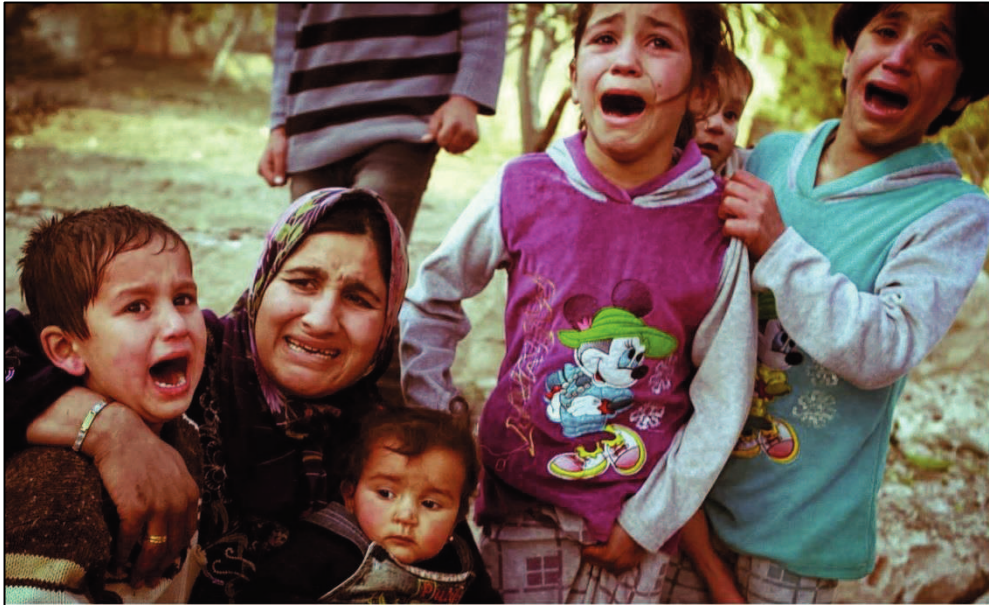
Obrázek 9: Syrské děti s matkou

Více než 50% běženců a uprchlíků jsou děti a z nich téměř 75 % tvoří děti mladší 12 let. Některé děti byly zraněny a mnoho z nich bylo přímými svědky válečného konfliktu a úmrtí druhých lidí, ničení vlastních domovů, vysídlení, byly odloučeny od některých členů rodiny a prošly opakujícím se násilím. To může mít za následek širokou škálu akutních psychosociálních problémů, jako jsou úzkosti a strachy, problémy se spánkem, smutek, deprese, zvýšená agresivita, nervozita, hyperaktivita a somatické potíže. Většina dětí nemá možnost pokračovat ve svém vzdělávání. Adolescenti uvádí, že se běžně setkávají s diskriminací a šikanou. Podle výzkumů se zdá, že dívky jsou vzniklou zátěží o něco více ohroženy než chlapci. Je velice důležité věnovat hodně pozornosti podpoře a aktivnímu zapojování dětí do volnočasových aktivit v uprchlických táborech .