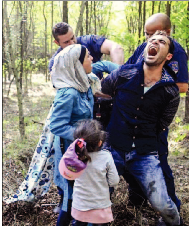
Obrázek 5: Zadržení na maďarských hranicích