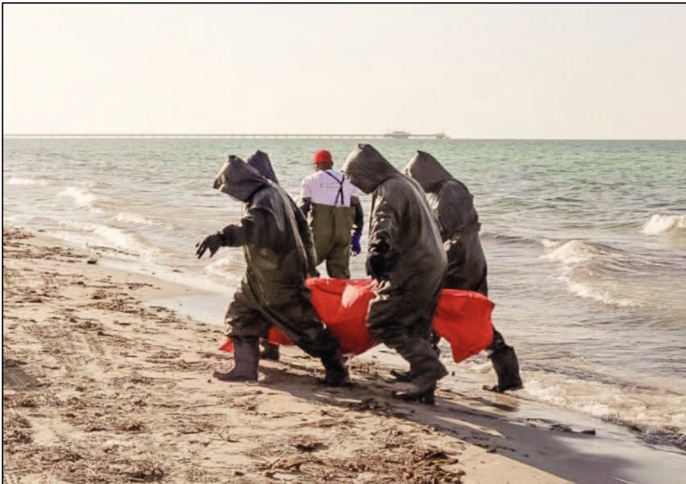
Obrázek 7: Oběť utonutí při útěku ze Sýrie

psychologická nebo psychiatrická péče. Navíc evropští odborníci na duševní zdraví nemusí mít vůbec povědomí o principech psychiatrické péče v arabských zemích.