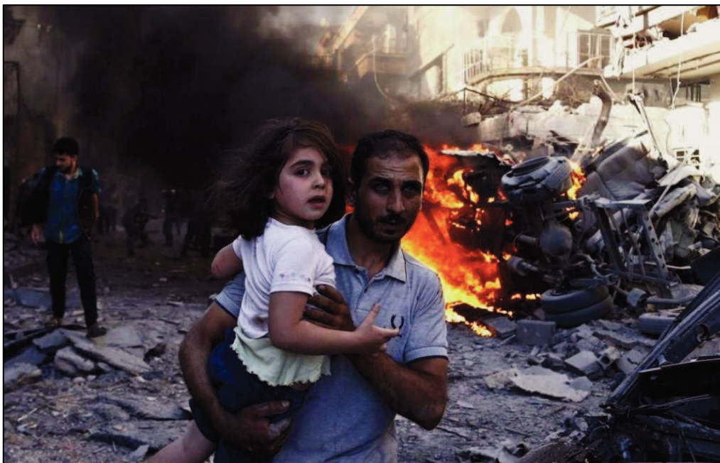
Obrázek 6: Obyvatelé města zasaženého bombardováním

Všechny uvedené projevy jsou typické pro jedince, kteří prožívají extrémní stres, ale nemají žádné psychické onemocnění. V případě, kdy stres významně naruší běžné fungování a adaptační schopnosti, může však vést i k psychickému onemocnění. Lze odhadovat, že v syrské populaci významně narostlo množství psychických onemocnění. Podle Světové zdravotnické organizace (WHO) se odhaduje nárůst množství osob s lehkým, středním nebo těžkým psychickým onemocněním z 12-13% v běžné populaci na 18-24% v populaci zasažené mimořádnou událostí.