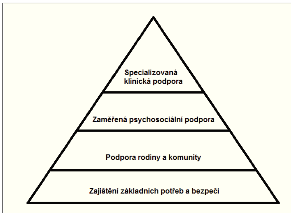
Obrázek 10: Pyramida psychosociální podpory

Na druhém stupni je posílení komunitní a rodinné podpory. Cílem tohoto druhu podpory je zajišťovat takové aktivity, které mezi uprchlíky posilují skupinovou soudržnost. Jedná se také o rekonstrukci a rozvoj komunitních vztahů, které jsou založeny na modelech přirozeného fungování v syrské společnosti. To zahrnuje také podporování rodinných vztahů, které působí jako základní ochrana před nepříznivými vlivy pro všechny své členy.