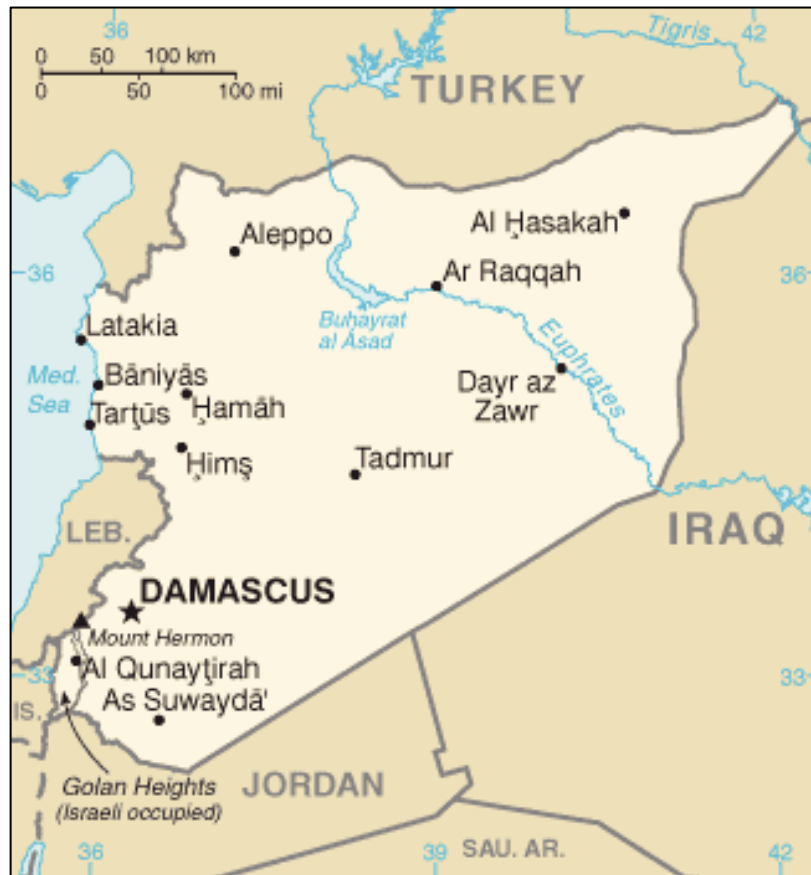
Obrázek 2: Mapa Sýrie a okolních států