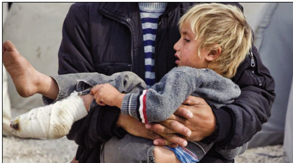
Obrázek 4: Zraněný syrský chlapec

válečných. Nevybíravé bombardování a ostřelování má za následek obrovské množství obětí a rozšíření hrůzy mezi civilním obyvatelstvem. Mimoto dochází k obléhání měst, vesnic a sousedství, jež způsobuje jejich odříznutí od zásobování potravinami, lékařské péče a ostatních potřeb. Akteři konfliktu také nedbají o speciální ochranu nemocnic a zdravotnických a humanitárních pracovníků.