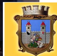
MĚSTSKÁ ČÁST PRAHA 22