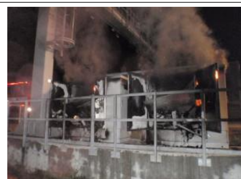
Foto č. 2 – Zapálený el. rozvaděč/agregát na D1.

I ve druhém čtvrtletí bylo zaznamenáno několik tzv. přímých akcí spojovaných s militantní anarchistickou scénou. V noci 1. května údajně došlo k „sabotáži“ výstavby rezidenčního bydlení v Praze, 8. května pak k zapálení el. rozvaděče mýtné brány na D1 . 24. května v Praze byly zapáleny vstupní dveře do prodejny s elektronikou . K uvedeným útokům se přihlásila Sít revolučních buněk prostřednictvím prohlášení uveřejněných na webových stránkách. Skupina se přihlásila k odkazu zahraničních organizací typu řecké Konspirace ohňových buněk nebo italské Neformální anarchistické federace , známých svými násilnými až teroristickými akcemi ve jménu radikální anarchistické a nihilistické ideologie. Při poškození mýtné brány došlo vedle škody na zařízení k výpadku výběru mýtného. Motivem třetího uvedeného útoku byl mj. nesouhlas s kamerovými systémy ve veřejném prostoru. Škoda ale byla způsobena firmě, která kamerové systémy prodává jen okrajově.