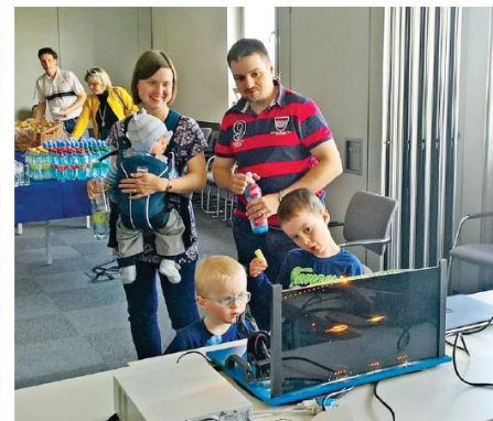
■ V rámci firemní akce „Co dělá můj táta“ se na pracovišti dostanou i rodinní příslušníci.

VH: Ano to určitě. Už v rámci soutěže jsme neměli nemalé plány na posouzení v této oblasti a ocenění nám do dalo kuráž do všeho se pustit a začít