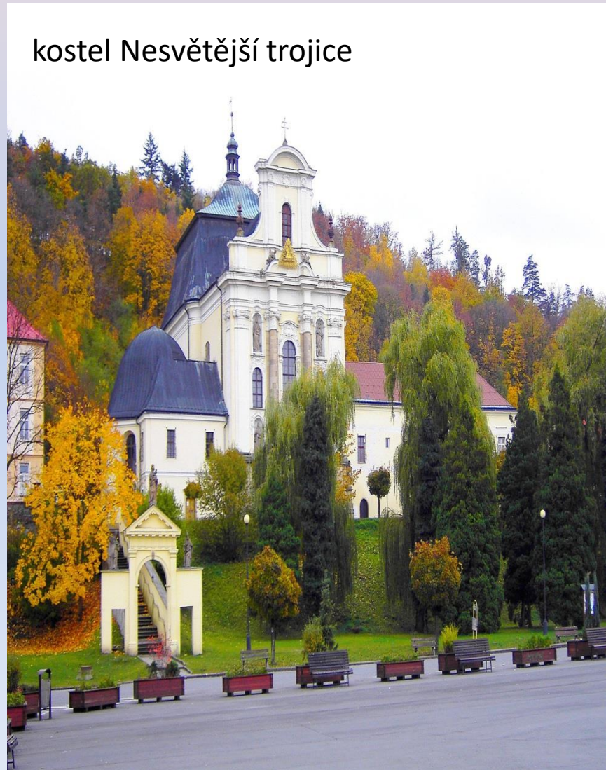
kostel Nesvětější trojice