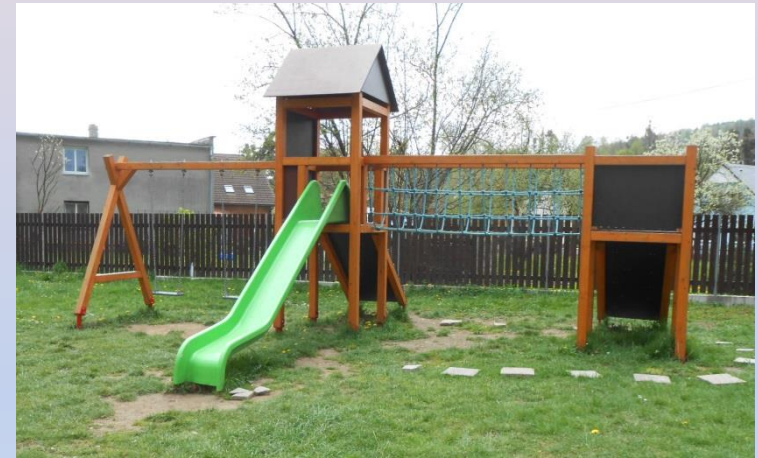
Místečko radosti Vlkovice

Místečko radosti Vlkovice je určeno nejen pro děti a mládež, ale pro ostatní obyvatele k organizování místních akcí a volnočasových aktivit