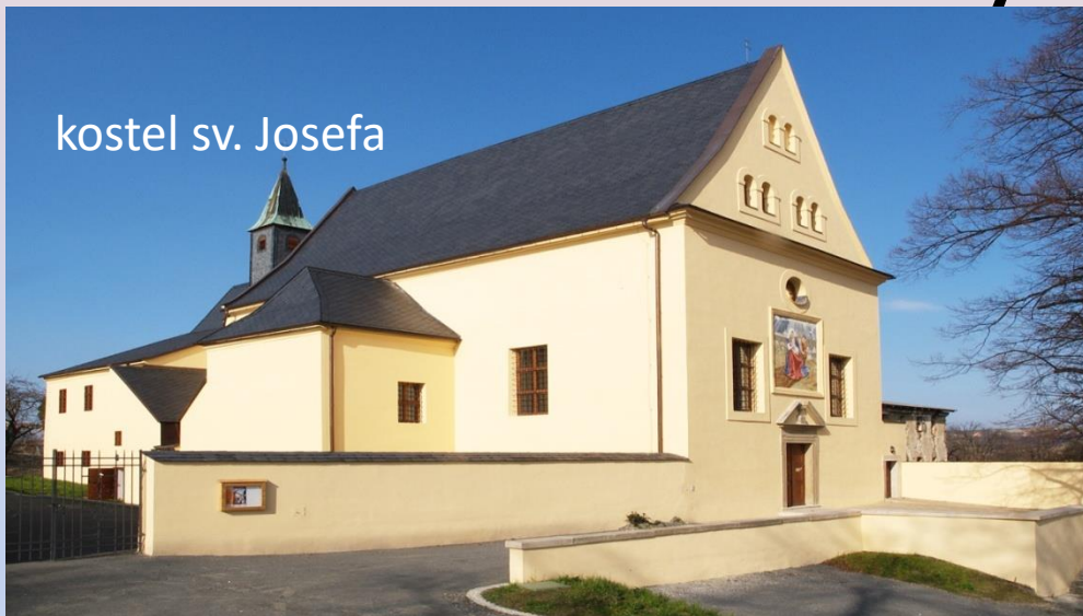
kostel sv. Josefa