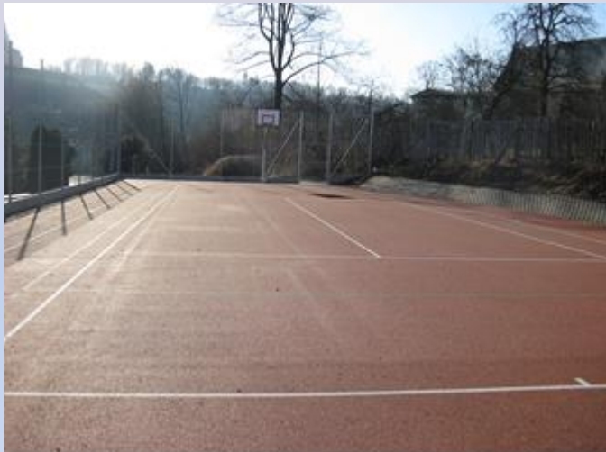
hřiště U Sýpky