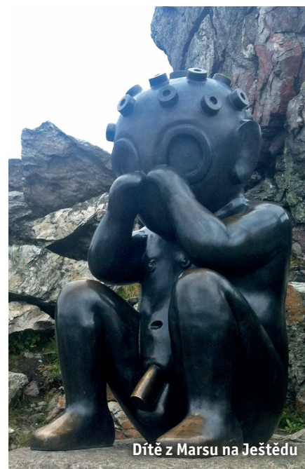
Dítě z Marsu na Ještědu