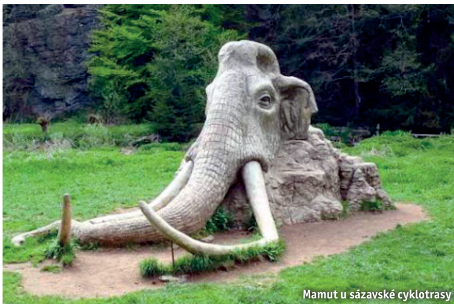
Mamut u sázavské cyklotrasy