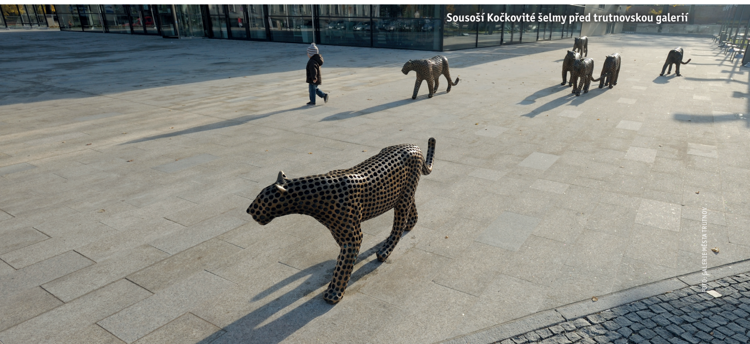
Sousoší Kočkovité šelmy před trutnovskou galerií

Jedním z měst, která se na umění v exteriéru zaměřují nejvíce, je Trutnov. Již posedmé ozdobí tamní veřejná prostranství na období od června do září sochy nejuznávanějších současných českých umělců. V rámci akce s názvem Sochy v Trutnově se zde letos představí prá-