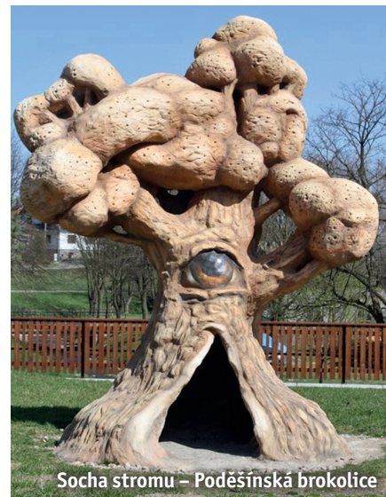
Socha stromu – Poděšínská brokolice