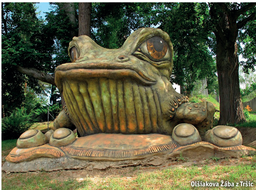
Olšiaková Žába z Tršic

Již zmíněný Zubr je zhruba čtyři metry dlouhý, váží jedenáct tun a od podzimu 2015 má své místo v Bystřici nad Pernštejnem v lokalitě Lužánky, v těsné blízkosti Pohádkové aleje pod dětským lanovým parkem. ■