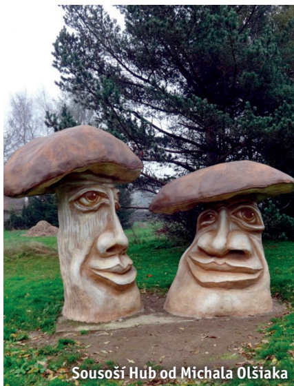
Sousoší Hub od Michala Olšiaka