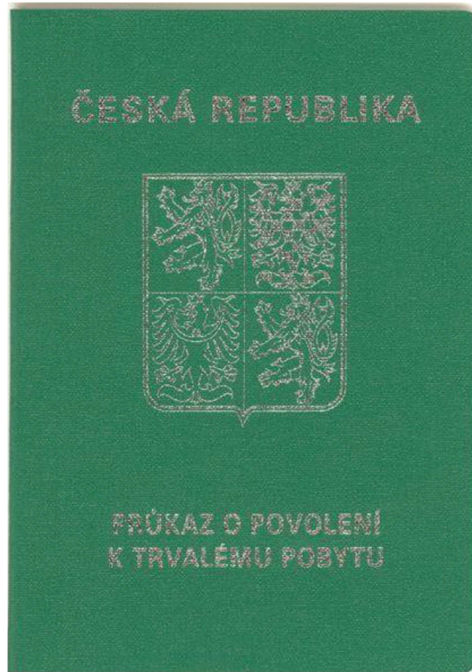
Přední strana dokladu (tmavě zelený doklad ve formě knížky, stříbrný tisk na přední straně)

Doklad je vydáván od 27. dubna 2006 rodinným příslušníkům občanů EU a od 1. ledna 2018 i občanům EU a občanům Norska, Islandu, Lichtenštejnska, Švýcarska a jejich rodinným příslušníkům.