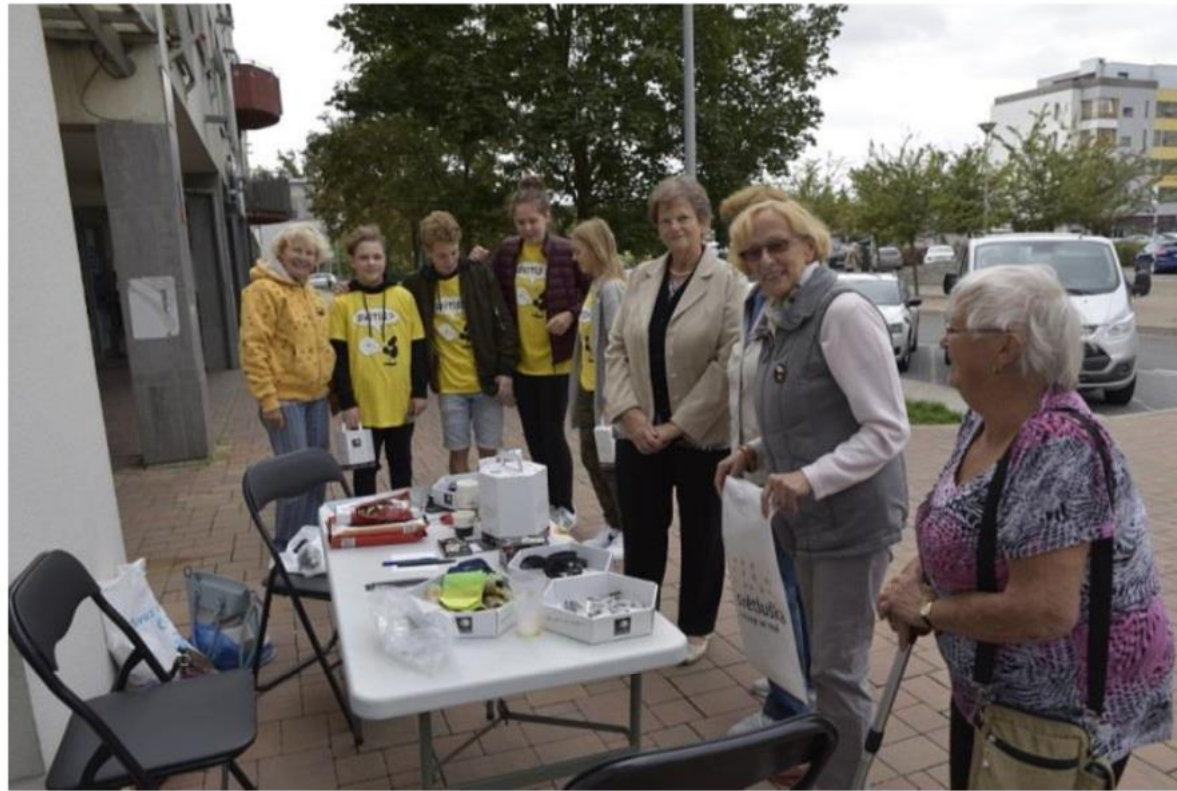
Světlušky v akci – každoroční charitativní sbírka