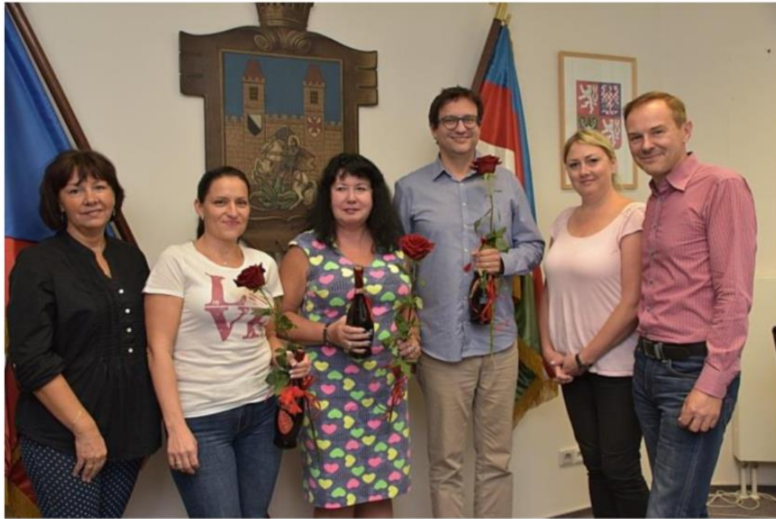
Ocenění dárců a dáreků krve