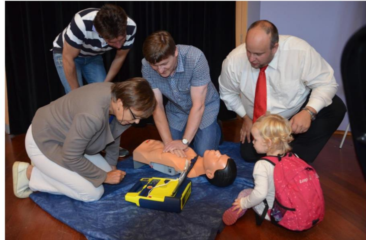
Školení zaměstnanců a zaměstnankyň úřadu k využití automatického externího defibrilátoru