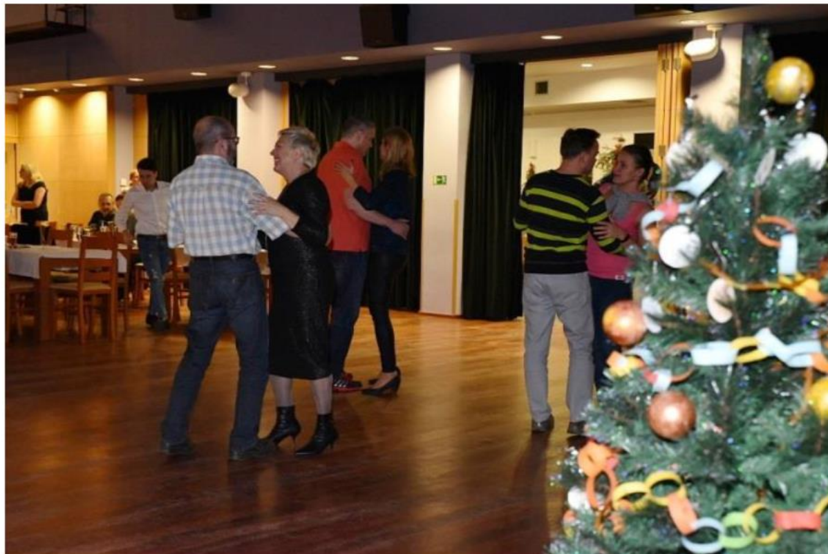
Společný vánoční večírek