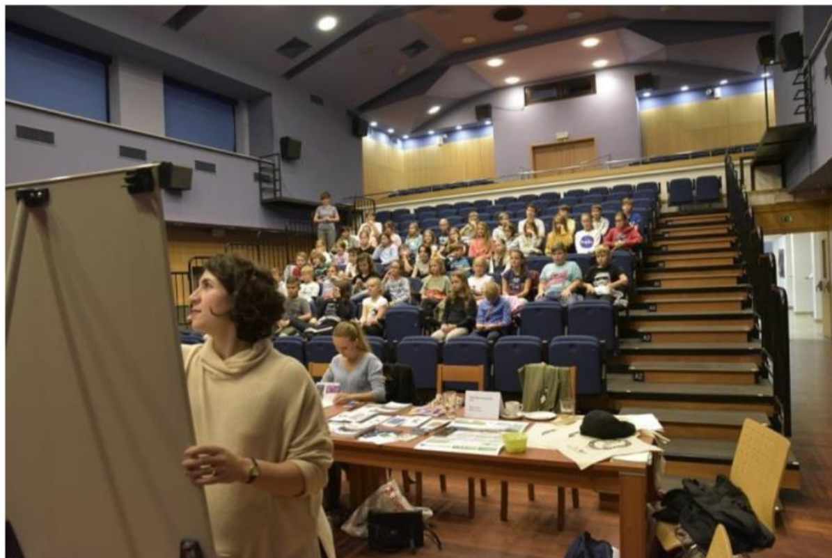
Dopoledne s integračním centrem v rámci Dne zdraví a rovných příležitostí