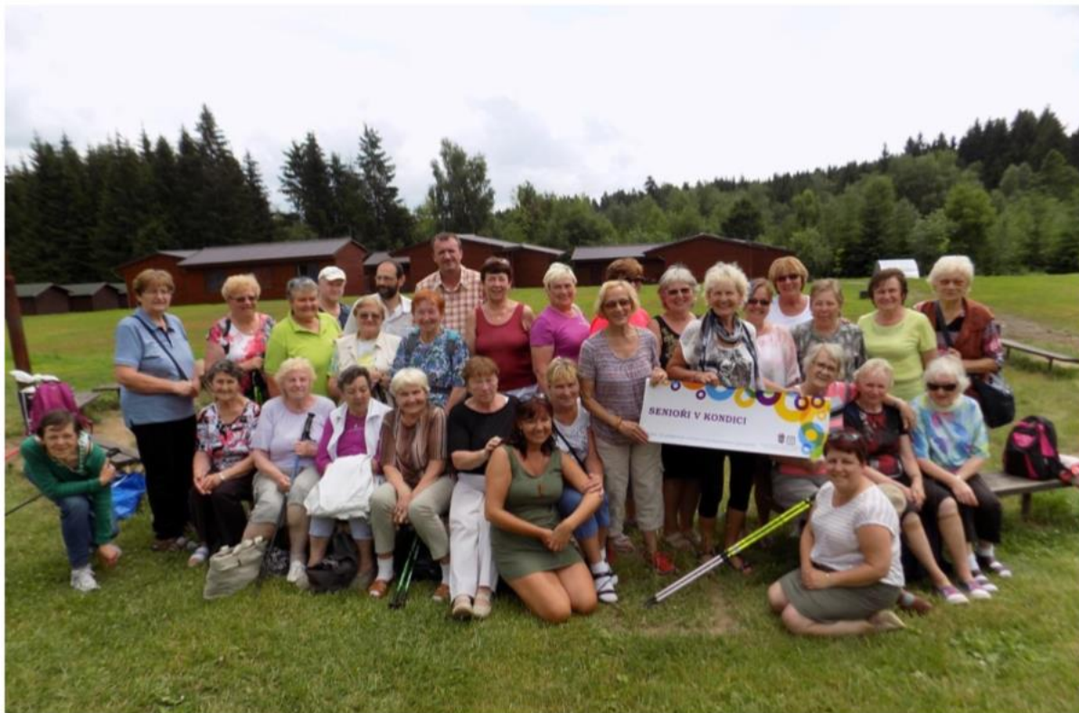
Z Letních kempů seniorů na Třech studních