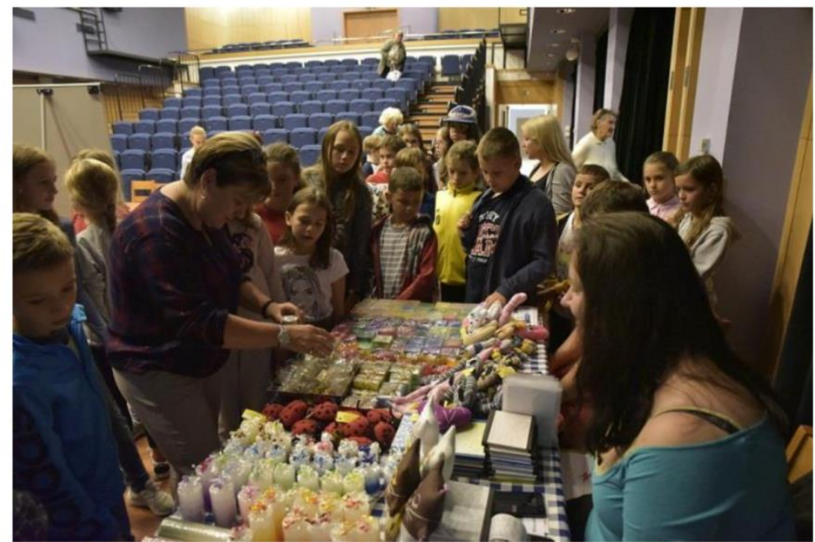
Podporujeme chráněné dílny (Den zdraví a rovných příležitostí)