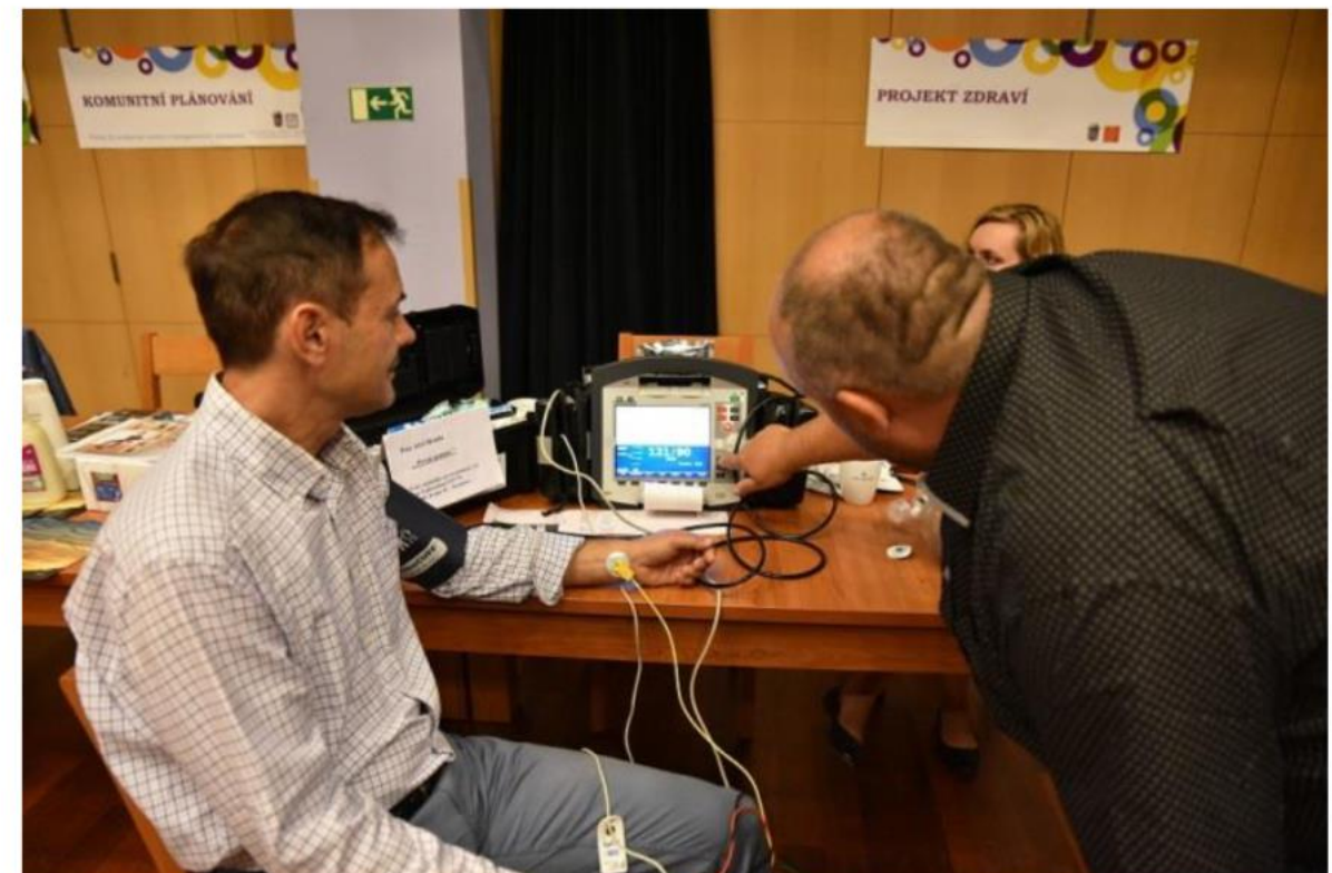
Tajemníkovi úřadu jsme raději nechali přeměřit tlak...