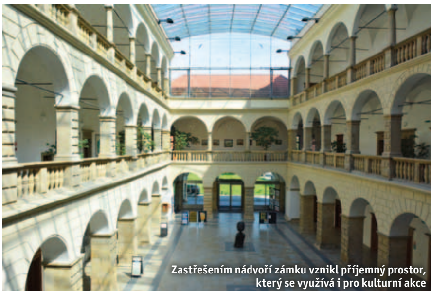
Zastřešením nádvoří zámku vznikl příjemný prostor, který se využívá i pro kulturní akce