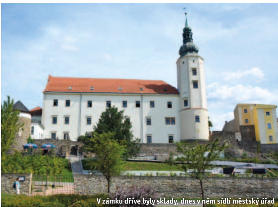
V zámku dříve byly sklady, dnes v něm sídlí městský úřad