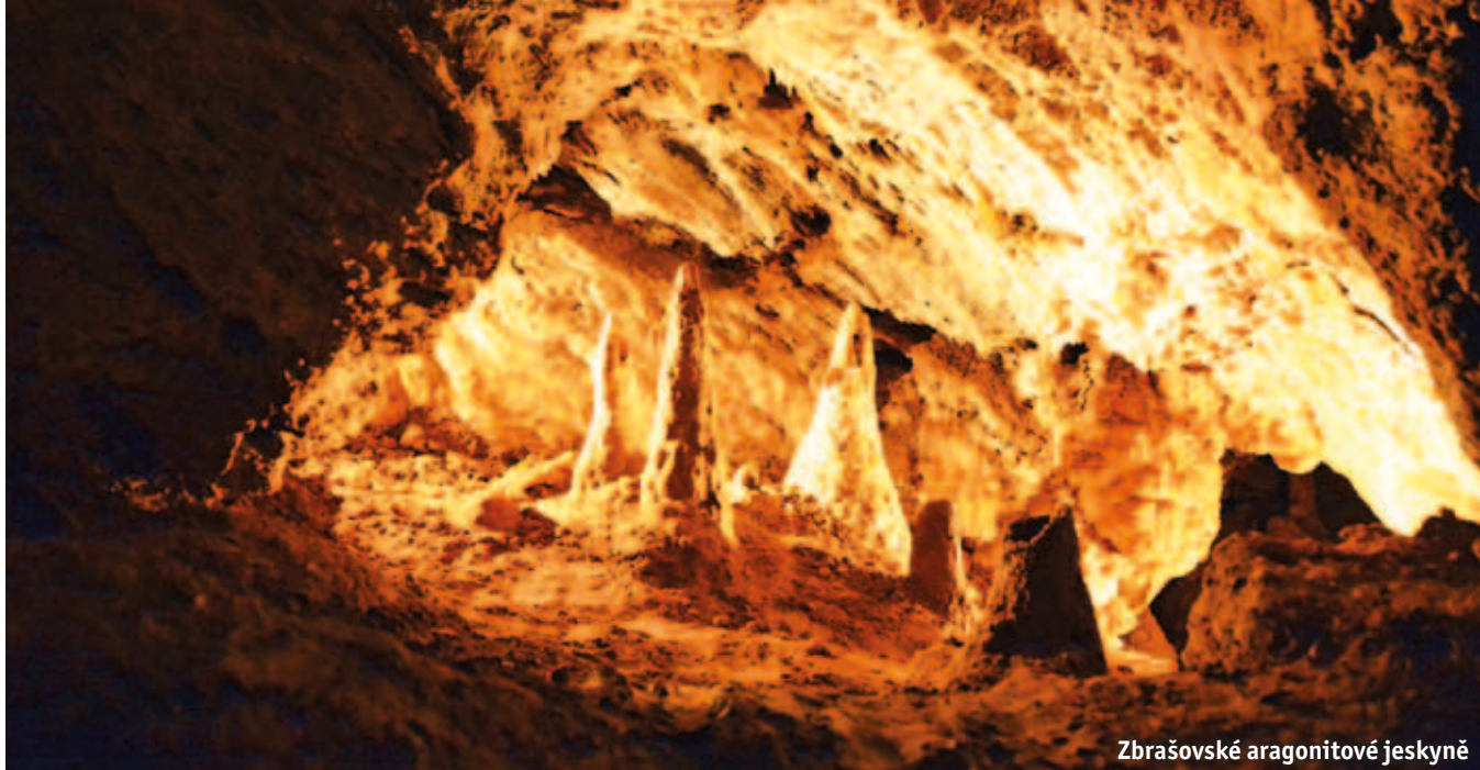
Zbrašovské aragonitové jeskyně

vysvětluje starosta. Hranice vyčleňují na sport a kulturu přes 20 milionů korun ročně. „Je to včetně provozu knihoven, muzeí a dalších kulturních zařízení. Asi osm milionů korun z této částky tvoří grantové programy,“ upřesňuje Jiří Kudláček.