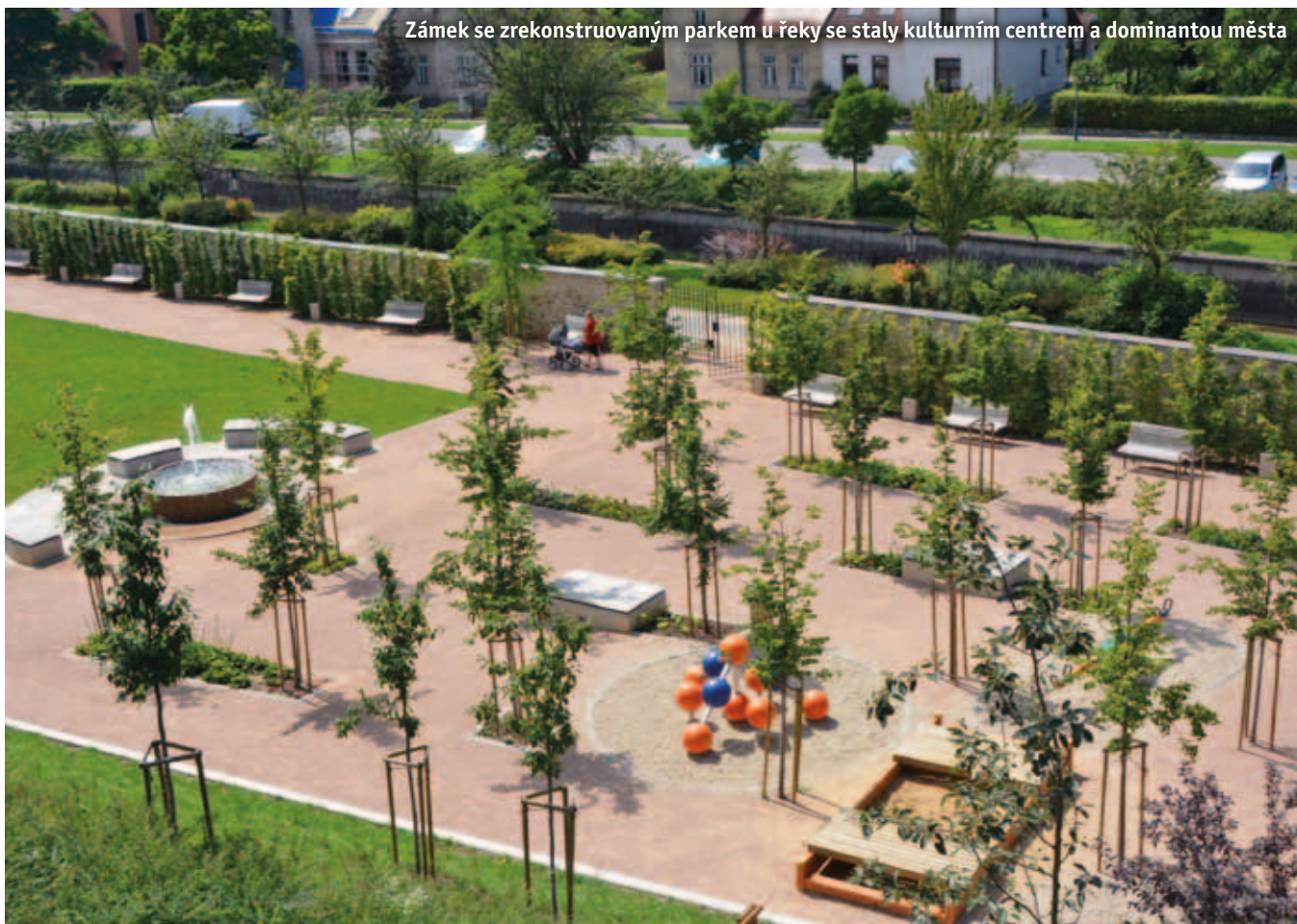
Zámek se zrekonstruovaným parkem u řeky se staly kulturním centrem a dominantou města