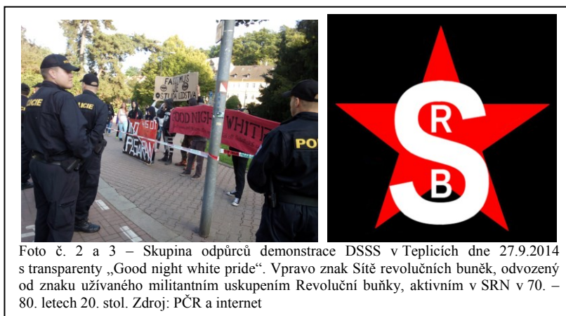
Foto č. 2 a 3 – Skupina odpůrců demonstrace DSSS v Teplicích dne 27.9.2014 s transparenty „Good night white pride“. Vpravo znak Síť revolučních buněk, odvozený od znaku užívaného militantním uskupením Revoluční buňky, aktivním v SRN v 70. – 80. letech 20. stol.

žhářskému útoku proti služebnímu vozidlu PČR v Ústí nad Labem , k čemuž se následně přihlásila prostřednictvím internetového prohlášení Síť revolučních buněk , známá již předchozími obdobnými, avšak neúspěšnými útoky. Nutno dodat, že činnost takového uskupení, byť virtuálního, byla v rámci anarchistické scény vnímána rozporuplně. Dle umírněných