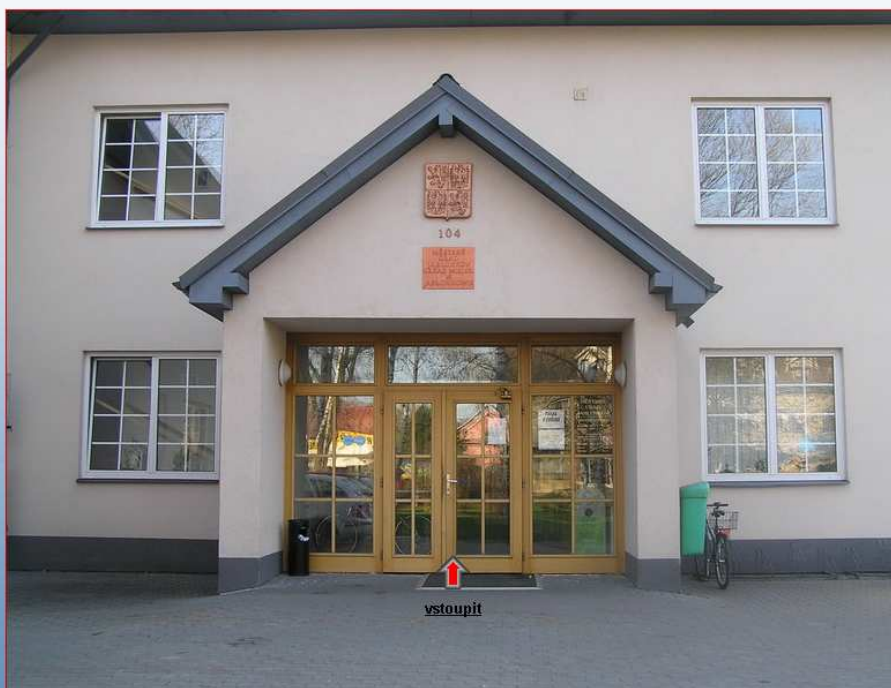
Vchod budovy č.p. 104 (B2)

Přílohy: fotografie pro ilustraci „Navigace“