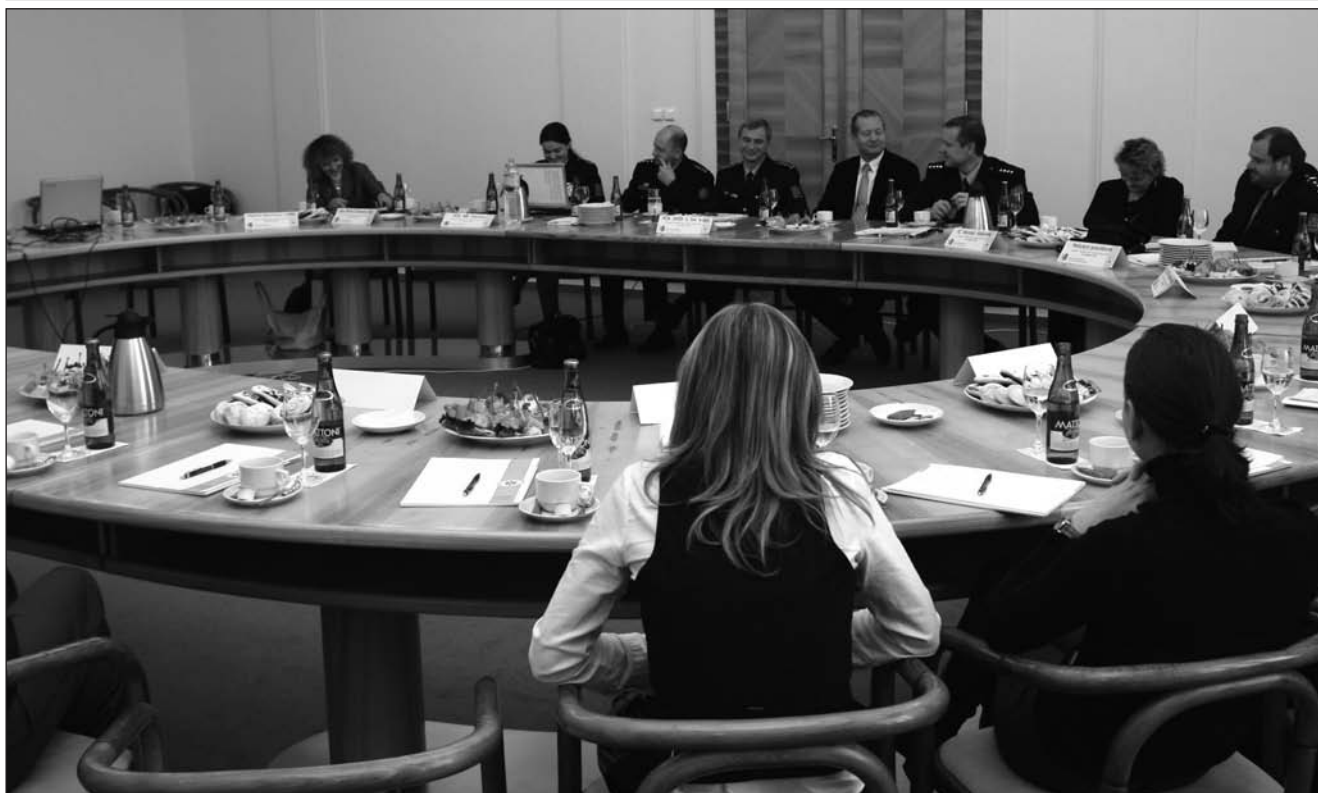
Semináře „u kulatého stolu“ se zúčastnili policisté, zástupci intervenčních center i další subjekty.