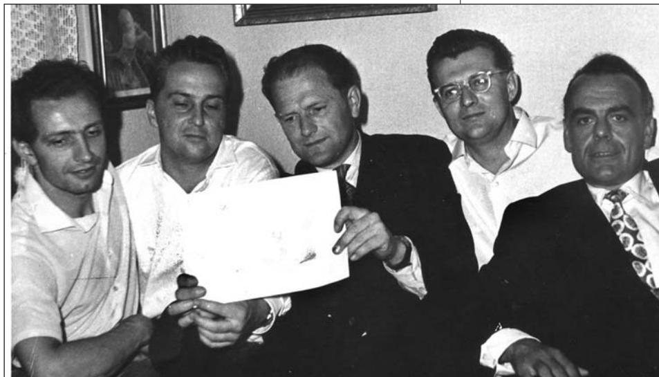
Vězení z nich udělalo přátele nadosmrti, kteří se rádi setkávali.

Někdy uprostřed noci jsem v místnosti, kde mne vyslýchali, zahlédl ministra vnitra Václava Noska v doprovodu tří sovětských důstojníků. Estébáci té návštěvě rusko-česky podávali hlášení o tom, jak vyšetřování pokračuje. A sotva se za Noskem a těmi Sověty zavřely dveře, začalo to znovu: Tak mluv, nebo odtud nevylezeš ani po čtyřech, s tím počítej... mluv...! Výkřiky a rány: pořád dokola. Až skoro do bezvědomí, po kterém jsem toužil. Nedělám ze sebe hrdinu, řval jsem jim tam bolesti, ale současně jsem přesvědčoval sám sebe, že musím tyranů za každou cenu vydržet, vždyť je to jen otázka času, protože následujícího dne začne přece převrat a vše bude v pořádku.