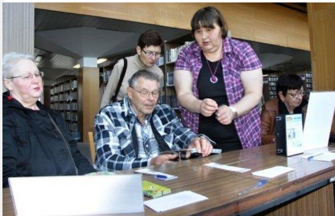
Letní promenádní koncerty, Den seniorů (1.10.)