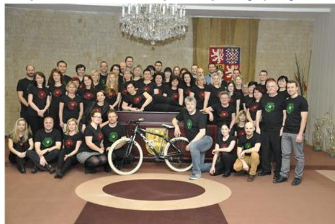
Materiální sbírka v rámci „Října pro neziskovky“