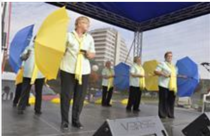
Letní promenádní koncerty, Den seniorů (1.10.)