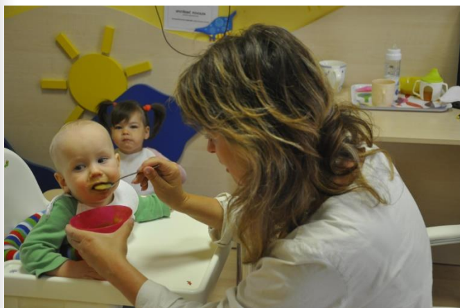
Firemní dobrovolnický den – kojenecký ústav