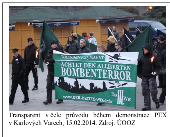
Transparent v čele průvodu během demonstrace PEX v Karlových Varech, 15.02.2014.

Z významnějších veřejných akcí v uplynulém období lze jmenovat 2. ročník demonstrace Světlo pro Drážďany , letos pořádané v Karlových Varech dne 15. února u příležitosti výročí spojeneckého bombardování Drážďan v roce 1945. Akce se zúčastnilo zhruba 150 osob, z nichž 120 bylo ze SRN. Oficiálně byla akce pořádána českou stranou, avšak ze samotného průběhu bylo zjevné, že demonstrace byla plně v německé režii. Stejně jako v loňském roce byl hlavním důvodem k organizaci akce na území ČR fakt, že v pietní shromáždění v Drážďanech pravidelně naráží na protesty a blokády ze strany odpůrců pravicových extremistů. Dále pak čeští neonacisté tímto způsobem usilují o prohloubení spolupráce s německými protějšky.