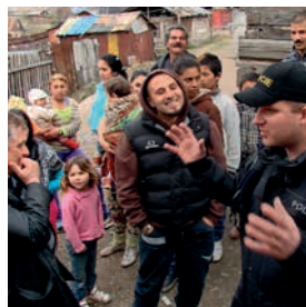
14 Projekt PDP 6 Zavádění policejních specialistů v oblasti policejní práce ve vztahu k minoritní skupině Romů v sociálně vyloučených lokalitách