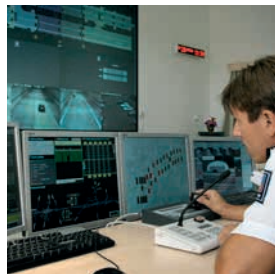
10 Projekt PDP 4 Aplikace geografického informačního systému Policie ČR v přímém výkonu služby