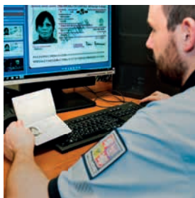
12 Projekt PDP 5 Zajištění jednotné platformy pro vytěžování dat z informačních systémů Policie ČR