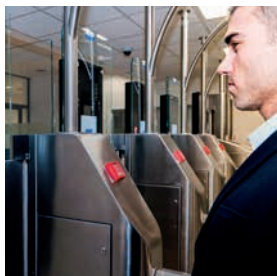
8 Projekt PDP 3 Posílení systému automatizované kontroly e-Pasu na mezinárodních letišťích (e-Gate)